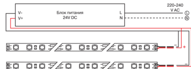
Схема подключения нескольких участков светодиодной ленты к источнику питания.