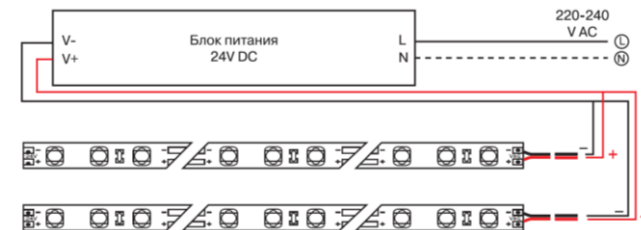
Схема подключения нескольких участков светодиодной ленты к источнику питания.

5.4 Чистку от загрязнений производите по мере необходимости мягкой ветошью, смоченной в слабом мыльном растворе.