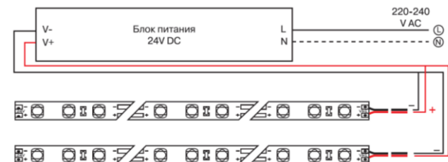
Схема подключения нескольких участков светодиодной ленты к источнику питания.

5.4 Чистку от загрязнений производите по мере необходимости мягкой ветошью, смоченной в слабом мыльном растворе.