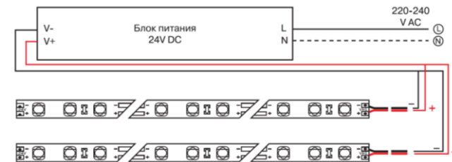
Схема подключения нескольких участков светодиодной ленты к источнику питания.

5.5 Чистку от загрязнений производите по мере необходимости мягкой ветошью, смоченной в слабом мыльном растворе.