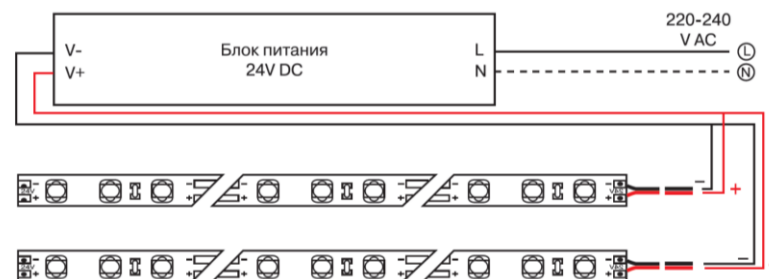
Схема подключения нескольких участков светодиодной ленты к источнику питания.

5.4 Чистку от загрязнений производите по мере необходимости мягкой ветошью, смоченной в слабом мыльном растворе.