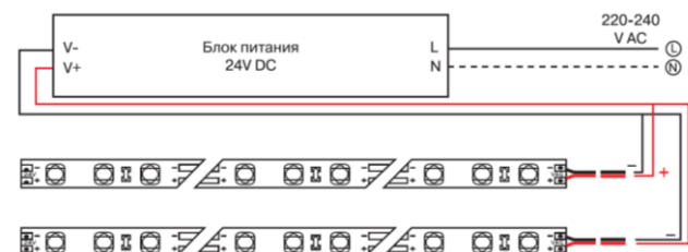
Схема подключения нескольких участков светодиодной ленты к источнику питания.

5.4 Чистку от загрязнений производите по мере необходимости мягкой ветошью, смоченной в слабом мыльном растворе.