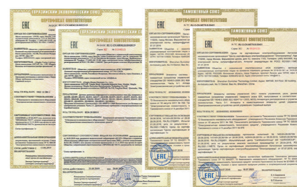
Сертификаты технического регламента Таможенного союза