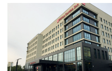
Гостиница HILTON GARDEN INN в г. Оренбурге Светильники эвакуационные ССА, светодиодные панели ДВО.