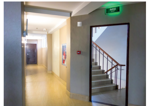
Лестница: аварийные светильники ДПА, датчики движения