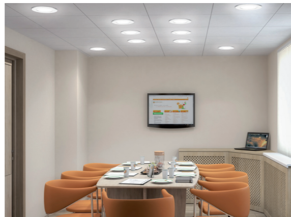
Переговорная зона: встраиваемые светильники ДВО