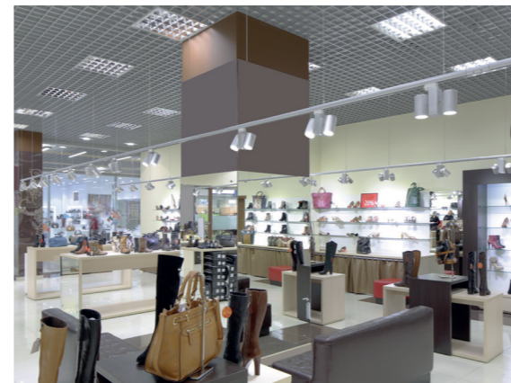
Бутик: трековые светильники, встраиваемые светильники ДВО