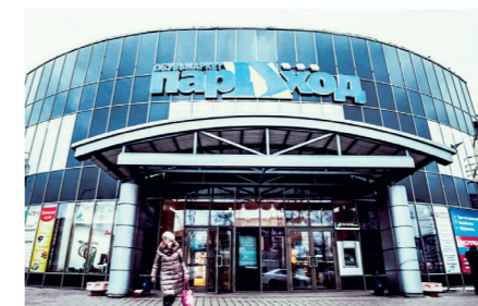
ТЦ «ПАРАХОД» в г. Екатеринбурге Светодиодные панели ДВО.