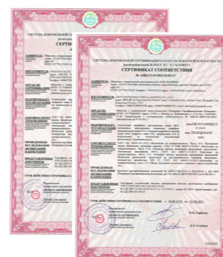
Пожарные сертификаты на ДПА, ССА, БАП

Многолетний опыт успешной работы принес IEK GROUP заслуженную репутацию надежного производителя. Итогом стало признание потребителей – дважды, в 2014 и 2016 годах, торговая марка IEK® становилась лауреатом рейтинга народного доверия «Марка №1 в России».