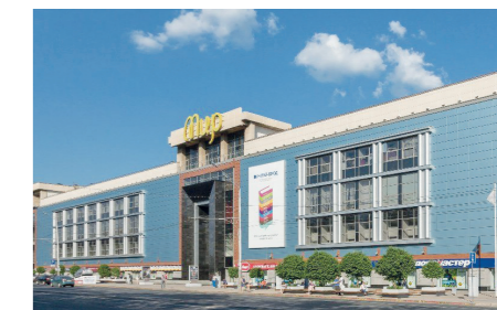
ТЦ «Мир» в г. Уфе Светодиодные панели ДВО, пылевлагозащищенные светильники ДСП.