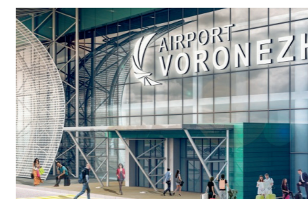
Аэропорт в г. Воронеже Светодиодные панели ДВО.