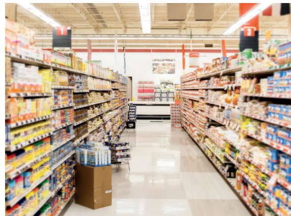
Торговый зал: линейные светильники, светильники ДСП