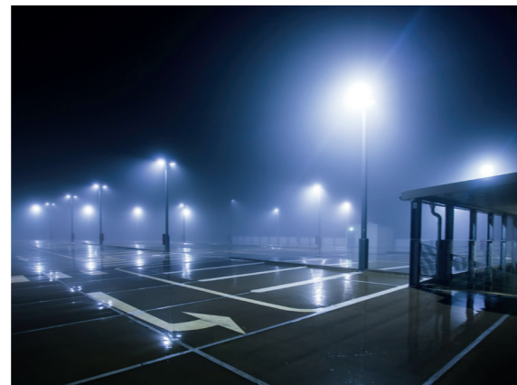
Парковка, освещение фасада: светильники консольные ДКУ, прожекторы СДО