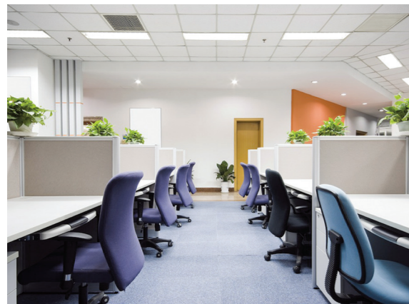
Офисное помещение: светодиодные панели ДВО