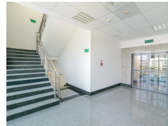
Лестница: аварийные светильники ДПА, светильники ДСП с датчиком движения