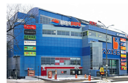
ТРЦ «Б-Класс» в г. Серпухове Встраиваемые светильники ДВО 1607.