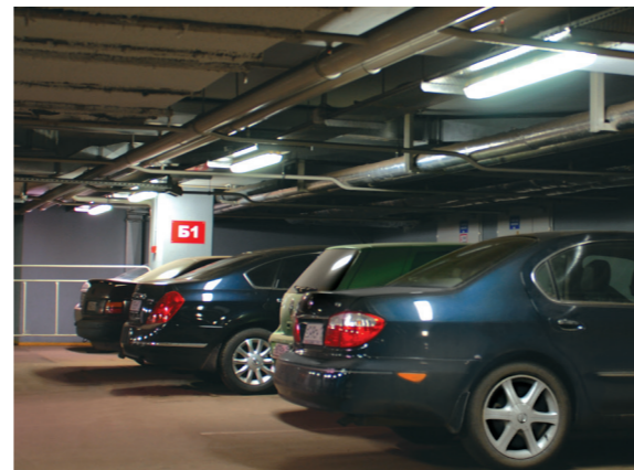
Подземная парковка: светильники ДСП, светильники ДПО