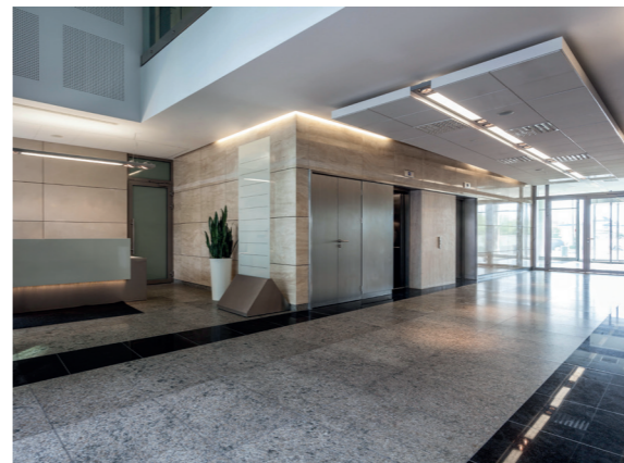
Холл: эвакуационные указатели ССА, линейные светильники ДБО