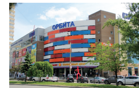
ТЦ «Орбита» в г. Ростове-на-Дону Светодиодные панели ДВО, прожекторы светодиодные СДО, блоки аварийного питания.