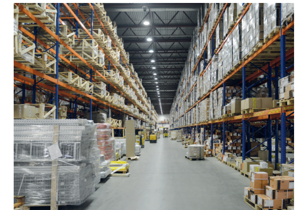
Склад: светильники для высоких пролетов ДСП