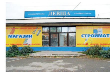
Сеть магазинов «Левша» в г. Нижнем Тагиле Светодиодные панели ДВО.